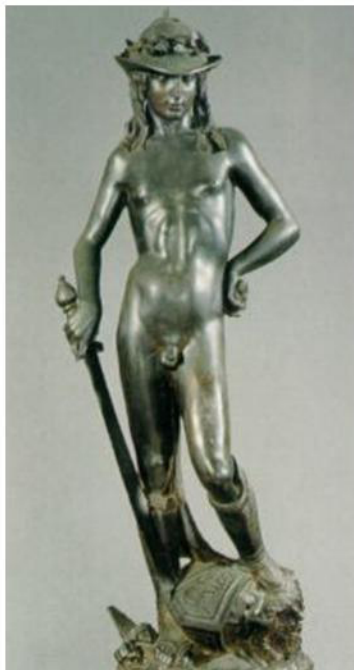
Donatello : David (Bargello)