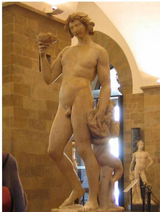
Michel-Ange : Bacchus ivre (Bargello)