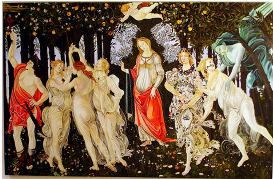
Botticelli : le printemps (Offices)