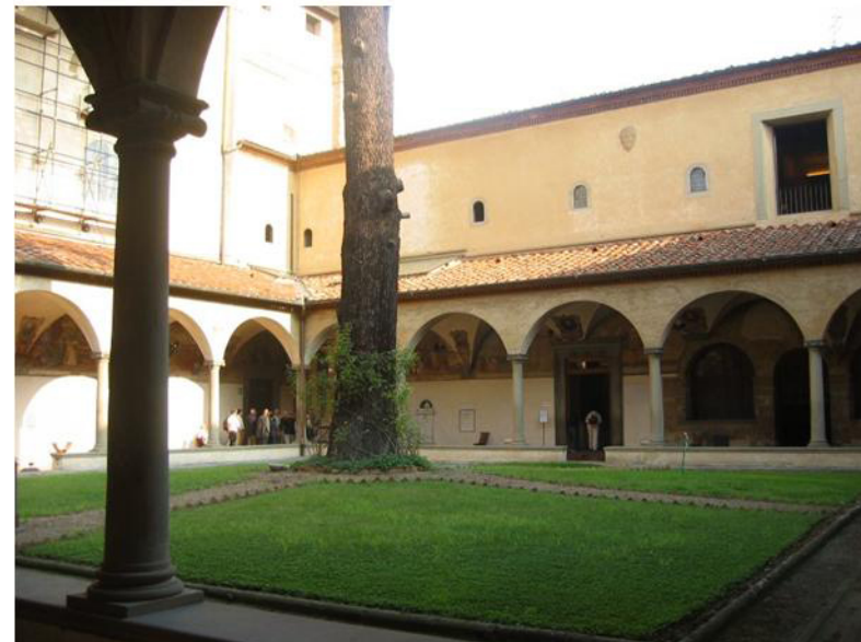
Cloître de San Marco : la cellule de Savonarole