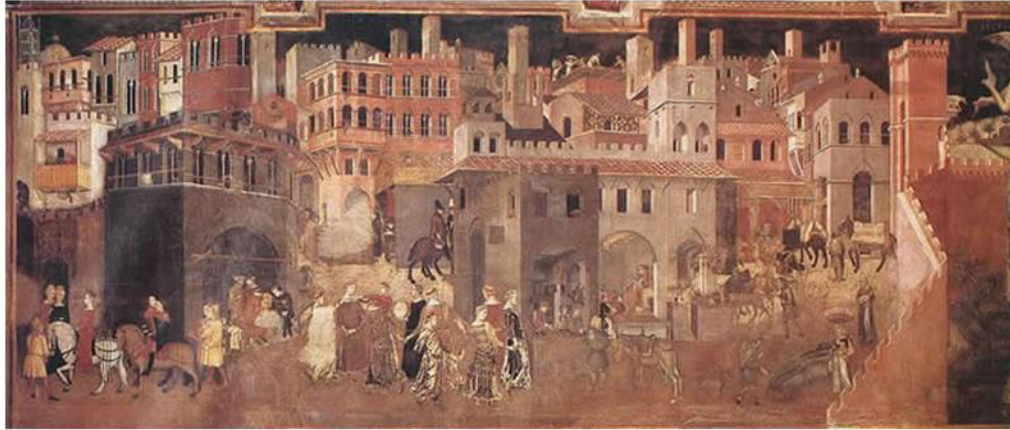
Ambrogio Lorenzetti, les fresques du Bon et du Mauvais gouvernement , palazzo publico (Sienne)