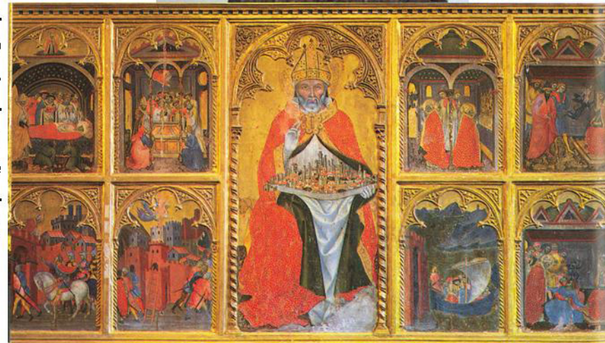
Gozzoli : San Gimignano protégeant la ville église San Agostino ou la même représentation (anonyme) au musée civique. (san gimignano)