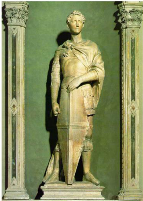
Donatello : Saint Georges , Bargello (Florence)