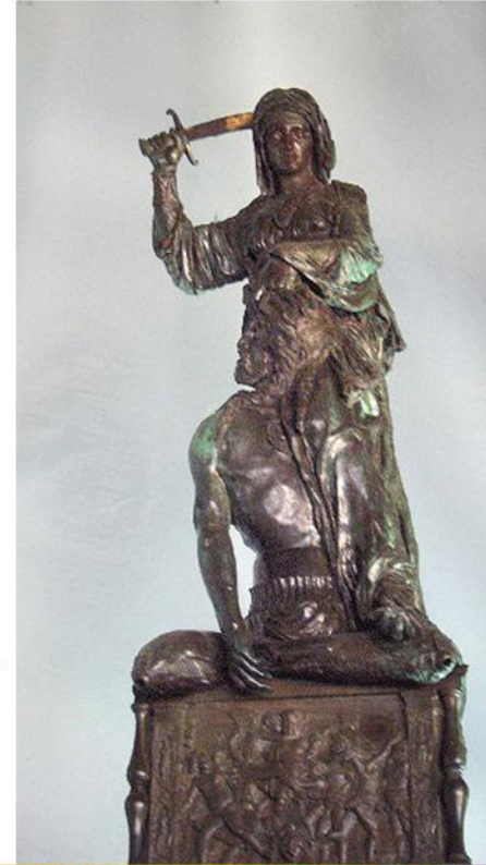
Donatello, Judith et Holopherne , place de la Seigneurie (Florence)