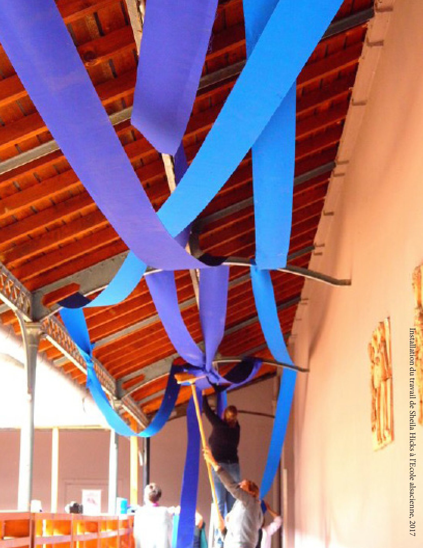
Installation du travail de Sheila Hicks à l'École alsacienne, 2017